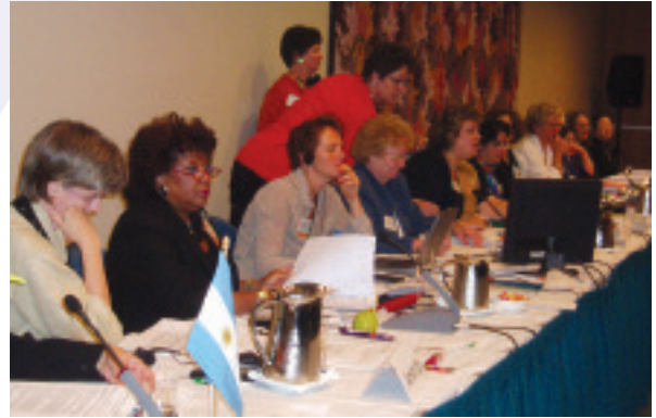
Junta Ejecutiva de la ICM