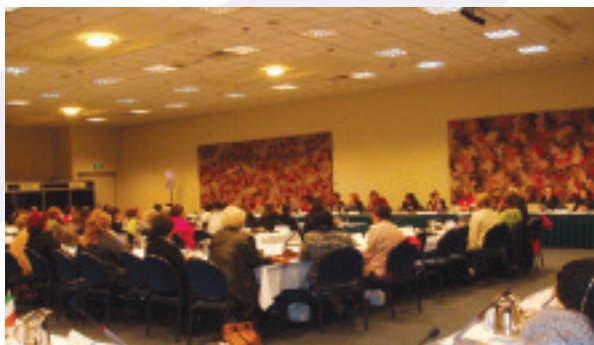
Plenario del consejo de la ICM